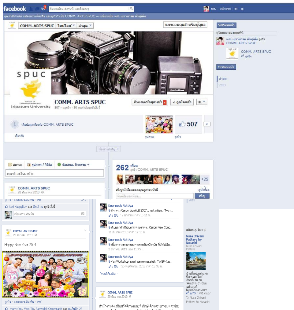
ตัวอย่างแฟนเพจคณะนิเทศศาสตร์ มหาวิทยาลัยศรีปทุม วิทยาเขตชลบุรี

นอกจากนั้น ปัจจุบันมีการใช้นำเสนอภาพถ่ายผ่านทาง social media ที่อาศัยเครือข่าย www เช่นเดียวกัน ได้แก่ facebook instagram ซึ่งสามารถใช้เผยแพร่ประชาสัมพันธ์ได้ตั้งแต่การสื่อสารภายในครอบครัว จนกระทั่งขยายเป็นธุรกิจได้เลยทีเดียว โดยผู้ใช้ภาพถ่ายลงในสื่อดังกล่าว จะมีต้องมีการสมัครสมาชิก โดยใช้อีเมล และสามารถโพสต์ข้อความ เรื่องราวขึ้นบนหน้าเวปได้ เช่นเดียวกัน และในปัจจุบันเทคโนโลยี การใช้โทรศัพท์มือถือทำให้อาจถ่ายภาพและ นำเสนอภาพได้รวดเร็วขึ้น เช่น เมื่อไปท่องเที่ยวสถานที่ใด แล้วถ่ายภาพนั้น จะสามารถโพสต์ข้อความ ภาพ หรือวิดีโอลงบน Social Media ได้ และผู้รับสารจะสามารถรับสารได้ทันที เช่นเดียวกัน ทำให้การนำเสนอภาพผ่านเทคโนโลยีที่ เป็นช่องทางในการสื่อสารทำได้ง่ายขึ้น จึงจำกัด ส่งผลให้การประชาสัมพันธ์ขยายตัวกว้างขึ้น ดังนั้น ช่างภาพ และผู้ถ่ายภาพควรตระหนัก ถึงการเผยแพร่ภาพถ่ายด้วยความระมัดระวัง หากเผยแพร่ภาพที่ไม่เหมาะสม ผู้รับสารจะรับ ข่าวสารนั้นได้รวดเร็ว อาจจะทำให้เกิดผลเสียได้อีกแห่งหนึ่งด้วย