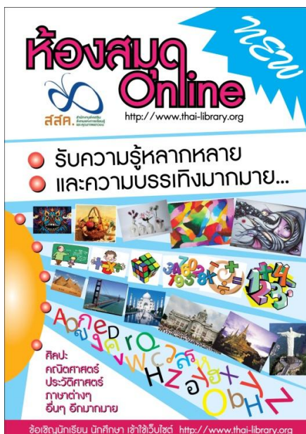
ภาพโปสเตอร์

3. โปสเตอร์ (poster) เป็นแผ่นกระดาษใหญ่แผ่นเดียวมีขนาดแตกต่างกันออกไป มีจุดมุ่งหมายเพื่อแจ้งเรื่องใดเรื่องหนึ่งอย่างย่อๆ หรือเป็นการเชิญชวนรณรงค์ในเรื่องใดเรื่องหนึ่ง ภาษาที่ใช้จะเป็นภาษาที่สั้นๆ ง่ายๆ แต่ได้ใจความกะทัดรัด ตัวหนังสือมีขนาดโตและชัดเจนพออ่านได้จากระยะไกล การจัดทำมีรูปแบบสวยงามและมีศิลปะ โปสเตอร์สามารถดึงดูดให้กลุ่มเป้าหมายสนใจได้จากภาพ และการจัดรูปแบบกราฟิก เพราะกลุ่มเป้าหมายเห็นส่วนที่เป็นพาดหัวชื่อ ภาพ และสัญลักษณ์ของหน่วยงานที่จัด ซึ่งภาพถ่ายจะต้องเป็นภาพที่สื่อความหมายได้ชัดเจน