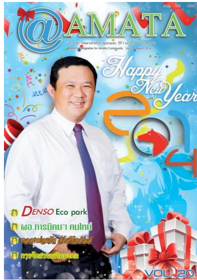
นิตยสารบุคคล

1.4 นิตยสารชาย-หญิง (man's and women's magazine) เป็นนิตยสารที่มุ่งเสนอเนื้อหาสาระเพื่อผู้ชายหรือผู้หญิงโดยเฉพาะ นิตยสารเพื่อผู้ชายจะมีเนื้อหาสาระเกี่ยวกับผู้ชาย และผู้ชายส่วนใหญ่จะให้ความสนใจ เช่น การผจญภัย การออกกำลังกาย เป็นต้น ส่วนนิตยสารผู้หญิงได้แก่ นิตยสารที่ลงเรื่องราวเกี่ยวกับแม่และเด็ก แฟชั่น การบ้านการเรือน เสริมสวย ความงาม เช่น แพรวสุดสัปดาห์ ดิฉัน การนำเสนอภาพในนิตยสารประเภทนี้ มีภาพหลากหลายทั้งภาพบุคคลชายหญิง เป็นลักษณะภาพแฟชั่น เพื่อโฆษณาสินค้าไปด้วย และภาพประกอบในคอลัมน์ต่างๆ ดังนั้นช่างภาพจะต้องศึกษาว่าจะนำเสนอเรื่องราวอะไร