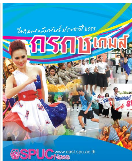
นิตยสารภาพ

1.1 นิตยสารภาพ (picture magazine) เป็นนิตยสารที่รายงานจากเรื่องราวต่างๆ ด้วย ภาพมากกว่าการอธิบายตัวหนังสือ เนื่องจากเชื่อว่า ภาพเป็นสื่อที่ถ่ายทอดและนำข่าวสารได้ชัดเจน กว่าตัวหนังสือ ดังนั้น ภาพจึงมีความสำคัญกับนิตยสารประเภทนี้เป็นอย่างมาก