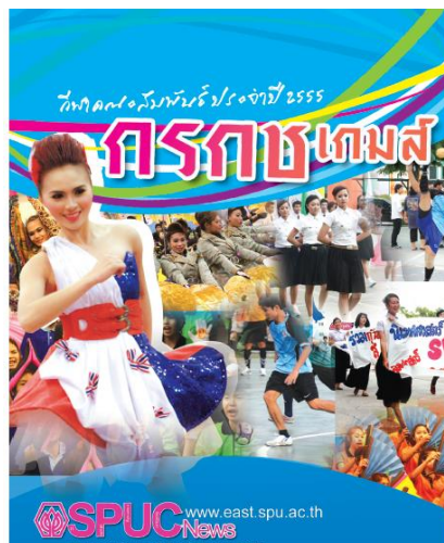
ภาพที่ นิตยสารภาพ

1.1 นิตยสารภาพ (picture magazine) เป็นนิตยสารที่รายงานจากเรื่องราวต่างๆ ด้วยภาพมากกว่าการอธิบายตัวหนังสือ เนื่องจากเชื่อว่า ภาพเป็นสื่อที่ถ่ายทอดและนำข่าวสารได้ชัดเจนกว่าตัวหนังสือ ดังนั้น ภาพจึงมีความสำคัญกับนิตยสารประเภทนี้เป็นอย่างมาก