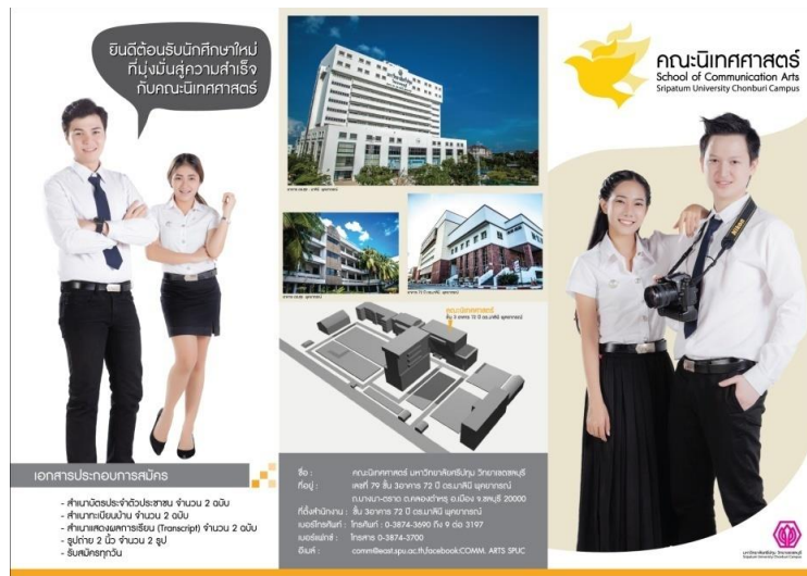
ภาพแผ่นพับ

4. แผ่นพับ (folder) เป็นลักษณะกระดาษแผ่นเดียวที่พับกลับไปมาได้ตามความต้องการ โดยบรรจุเนื้อหารายละเอียดสั้น กระทัดรัด ได้ใจความ จับใจความได้ง่าย และรวดเร็ว ซึ่งจัดทำขึ้น เพื่อแนะนำองค์กร หรือใช้แจกในโอกาสพิเศษที่มีการแสดง หรือการจัดนิทรรศการ จึงต้องจัดทำให้สวยงาม น่าอ่าน ใช้กระดาษอย่างดี มีสีสันสวยงาม เช่น แผ่นพับประชาสัมพันธ์คณะนิเทศศาสตร์ มหาวิทยาลัยศรีปทุม วิทยาเขตชลบุรี