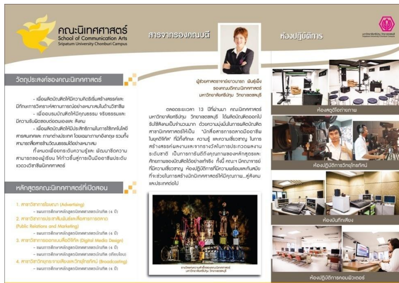
ภาพแผ่นพับ