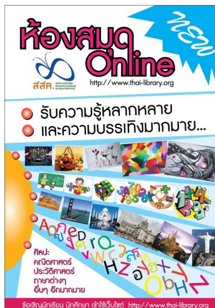
ภาพโปสเตอร์

3. โปสเตอร์ (poster) เป็นแผ่นกระดาษใหญ่แผ่นเดียวมีขนาดแตกต่างกันออกไป มีจุดมุ่งหมายเพื่อแจ้งเรื่องใดเรื่องหนึ่งอย่างย่อๆ หรือเป็นการเชิญชวนรณรงค์ในเรื่องใดเรื่องหนึ่ง ภาษาที่ใช้จะเป็นภาษาที่สั้นๆ ง่ายๆ แต่ได้ใจความกะทัดรัด ตัวหนังสือมีขนาดโตและชัดเจนพออ่านได้จากระยะไกล การจัดทำมีรูปแบบสวยงามและมีศิลปะ โปสเตอร์สามารถดึงดูดใจกลุ่มเป้าหมายสนใจได้จากภาพ และการจัดรูปแบบกราฟิก เพราะกลุ่มเป้าหมายเห็นส่วนที่เป็นพาดหัว ข้อ ภาพ และสัญลักษณ์ของหน่วยงานที่จัด ซึ่งภาพถ่ายจะต้องเป็นภาพที่สื่อความหมายได้ชัดเจน