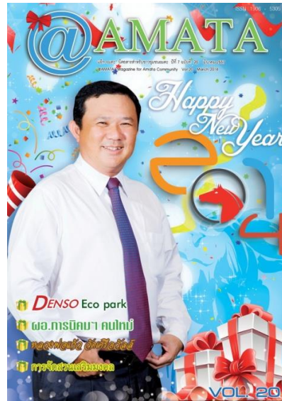
ภาพนิตยสารบุคคล

1.4 นิตยสารชาย-หญิง (man's and women's magazine) เป็นนิตยสารที่มุ่งเสนอเนื้อหาสาระเพื่อผู้ชายหรือผู้หญิงโดยเฉพาะ นิตยสารเพื่อผู้ชายจะมีเนื้อหาสาระเกี่ยวกับผู้ชาย และผู้ชายส่วนใหญ่จะให้ความสนใจ เช่น การผจญภัย การออกกำลังกาย เป็นต้น ส่วนนิตยสารผู้หญิงได้แก่นิตยสารที่ลงเรื่องราวเกี่ยวกับแม่และเด็ก แฟชั่น การบ้านการเรือน เสริมสวย ความงาม เช่น แพรวสุดสัปดาห์ ดิฉัน การนำเสนอภาพในนิตยสารประเภทนี้ มีภาพหลากหลายทั้งภาพบุคคลชายหญิง เป็นลักษณะภาพแฟชั่น เพื่อโฆษณาสินค้าไปด้วย และภาพประกอบในคอลัมน์ต่างๆ ดังนั้นช่างภาพจะต้องศึกษาว่าจะนำเสนอเรื่องราวอะไร