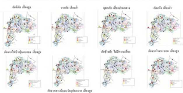
ภาพที่ 1 ความเสี่ยงจากสาธารณภัยในอำเภอเมืองชลบุรี